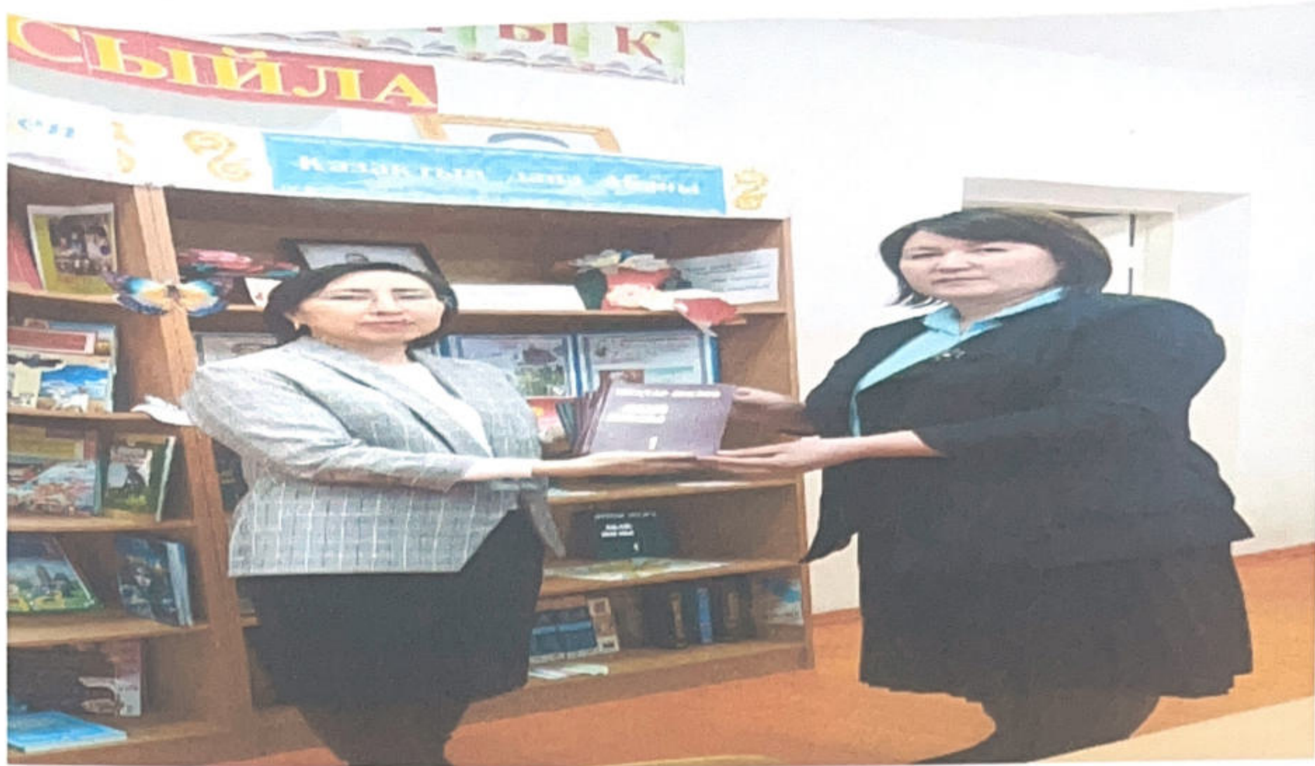
«Кітапханаға кітап сыйла» акциясы